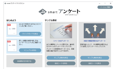
クイックメニュー